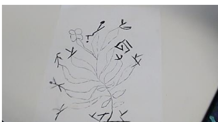
Figure 5, Fatime

Certains élèves nous ont aussi confié pratiquer l'écriture créative dans leur langue, poèmes en mongols, ou contes en arménien par exemple. Pour d'autres, ces ateliers ont été l'occasion d'exprimer à la fois des appartenances et des compétences littéraires auxquelles l'école était jusque-là restée aveugle. Les figures 5 et 7, très différentes l'une de l'autre, peuvent pourtant être rapprochées du fait qu'elles introduisent à l'école des éléments de connaissance et de compétence de leurs auteurs dans l'écriture d'autres langues (l'arabe pour la figure 7 et le gorane pour la figure 5).