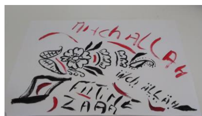
Figure 6, Fatime

Ces plurilittératies, qui apparaissent ici (figures 5 et 7) comme étant le fait d'élèves migrants qui ont construits des compétences hors l'école, naissent aussi parfois au sein de la classe, à l'occasion précisément des ateliers proposés. C'est ce qu'illustre la figure 4, sur laquelle un élève de la CLA-NSA a pris l'initiative de collecter auprès de ses camarades des "échantillons" des différents systèmes d'écriture en présence. Cet exemple, mais celui aussi rencontré dans la classe de SEGPA où un élève français "monolingue" a sollicité l'aide de certains de ses pairs pour écrire son prénom en caractères arabes, ajouté à l'observation des circulations qui se sont fait jour durant les ateliers, me semblent éclairer le plaisir et l'intérêt suscités par les expériences scolaires ou extra-scolaires des pairs. Plaisir et intérêt qui opèrent comme source d'appropriation, de construction de connaissances propres à celui qui utilise pour son œuvre propre les expériences des autres.