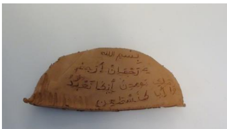
Figure 7, Abdelghani

Aux objectifs énoncés ci-devant répondent les analyses - construites en collaboration avec les élèves - de leurs pratiques, de leurs œuvres commentées, de leurs représentations. Ces analyses tendent à montrer une grande diversité des pratiques et représentations, diversité qui, prise au sérieux, devrait constituer une ressource protéiforme pour la didactique de l'écrit. Ressource protéiforme, parce qu'elle revêt des atours linguistiques (N. Auger a montré comment comparer les langues pour en apprendre d'autres), qu'elle permet une pédagogie du détour (par les arts plastiques notamment), qu'elle s'enracine dans l'expérience des élèves pour travailler leur créativité, mais encore parce qu'elle me semble permettre d'accompagner les élèves dans le tissage d'un réseau qui les aide à assumer leurs appartenances plurielles, évolutives et non exclusives les unes des autres.